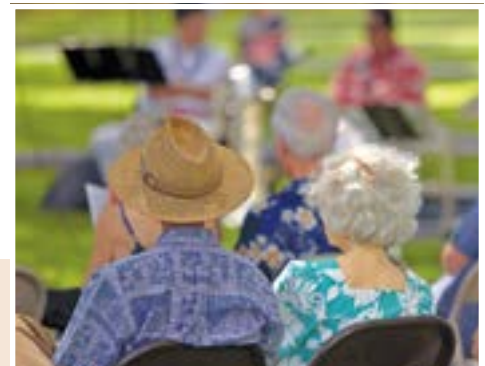
© Steen Wackenhausem | Hemera | Thinkstock

La ciudad de Norwalk presenta la serie de conciertos de verano los miércoles del 9 de julio al de 13 agosto a las 7:00 p.m. en los jardines del Centro Cívico, ubicado en 12700 Norwalk Boulevard. La entrada es gratis. Llegue temprano para que encuentre un buen lugar. Lleve sus cobijas, sillas y su canasta de comida y déjese serenar bajo las estrellas. Habrá refrigerios a la venta. Al terminar el concierto, le agradeceremos si por favor recicle sus envases de bebidas echándolos en el bote azul y dorado y en los depósitos de botellas que se encuentran a lo largo de los jardines.